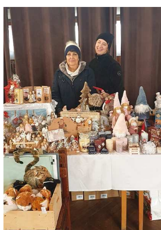
Text a foto Jitka Říhová, foto Veronika Škodová