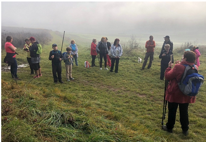
Mlha na cestě připomínala Šumavu