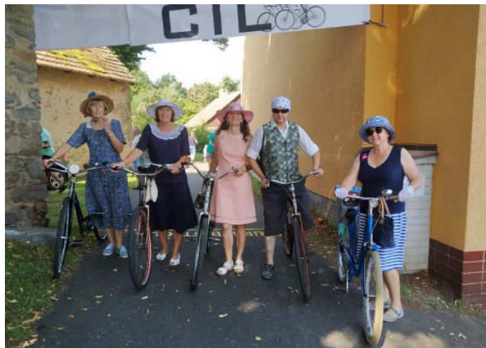
Písecký KVP v dobových oblecích a na retro kolech