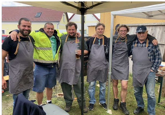
Vítězný tým ze Zábοří

Kolem 18. hodiny již byla všechna grilovaná prasata snědena, hlasování ukončeno a soutěžící i hosté vyhlíželi výsledky soutěžního klání. A že to byl vyrovnaný souboj!