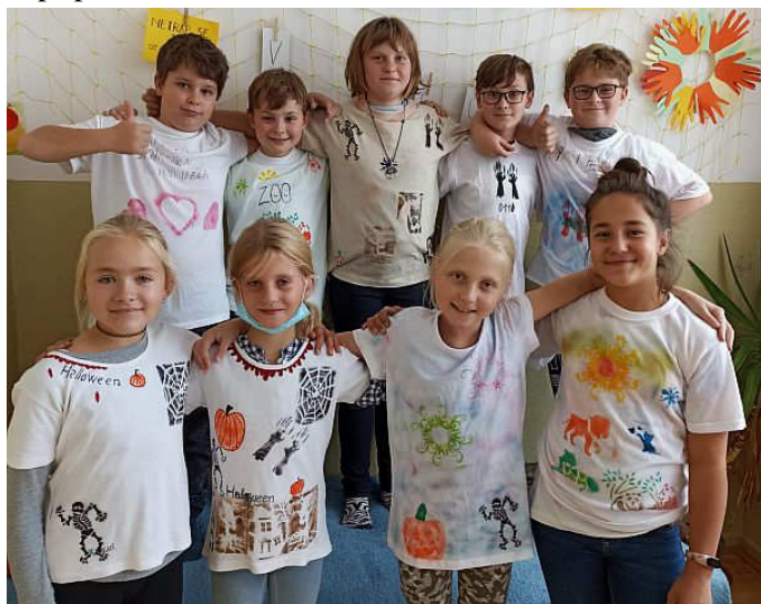
Trička vyrobená na kroužku „dovedných rukou“

Letos jsme si nenechali ujít ani výlov rybníka Chvalov. Jelikož se jedná o exkurzi, kterou se zájmem před pár lety sledovali žáci prvního i druhého stupně, rozhodli jsme se, že ani tento rok žáky o výlov nepřipravíme.