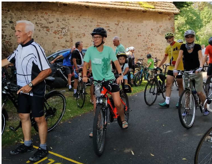
Nejmladší účastník se prozatím jenom vezl

Druhá srpnová sobota patřila od rána mezi ty krásné letní dny s blankytně modrou oblohou a s ostře pálivými paprsky slunce. Ty také již během dopoledních příprav přivedly účastníky cyklistické akce „Tour de Battaglia 2021“ pod stínící korunu majestátné zábořské lípy za budovou obecního úřadu, kde probíhala prezentace a uvítání ze strany pořadatelů.