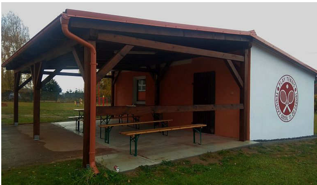
Nově zrekonstruované důstojné prostředí pro mateřskou školu a tenisty

Všem našim čtenářům a spoluobčanům přeji krásný letošní podzim. A doufejme, že se život i přes současnou zhoršující se situaci brzy vrátí do předcovidových kolejí.