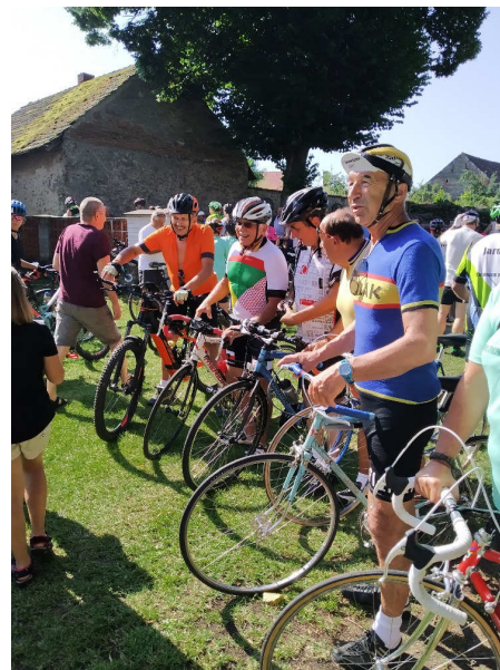
Na startu nadšenci v každém věku