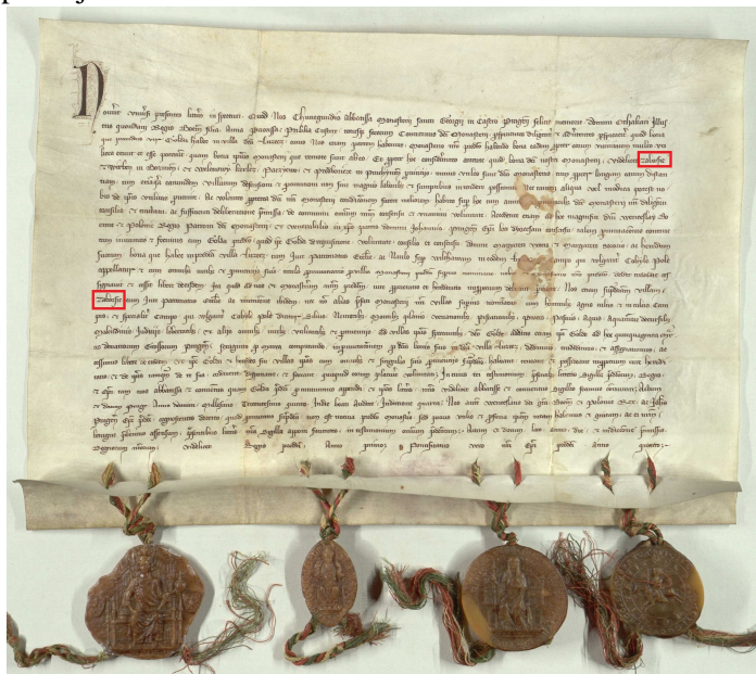
Listina s nejstarší písemnou zmínkou o Záboreň