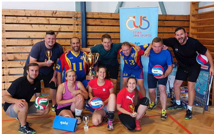
Domácí tým při focení pro média

Poslední srpnová sobota bývá pravidelně zasvěcena volejbalovému turnaji smíšených družstev Záborská smeč. Bohužel v loňském roce byla tradice této akce přerušena a vinou koronavirové epidemie se na putovním poháru objevil vítězný štítek s názvem „Covid 19“. O to smutnější byl fakt, že bylo přihlášeno téměř rekordních 10 týmů. V letošním roce nakonec účast nebyla tak hojná, o vítězství se přijelo poprat nakonec 5 družstev.