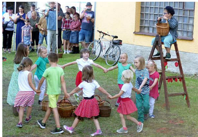
Děti z MŠ při svém pouťovém vystoupení

z třešní předvedly děti s nadšením sobě vlastním a své vystoupení si moc užily. Jejich starší kamarádi z 1. - 7. třídy v kostkovaných košilích si s chutí zatancovali country tance. „Babky“, ze kterých se vyklubaly šikovné gymnastky, byly rovněž skvělé. Díky všem učitelům za bleskové nacvičení tohoto programu s dětmi.