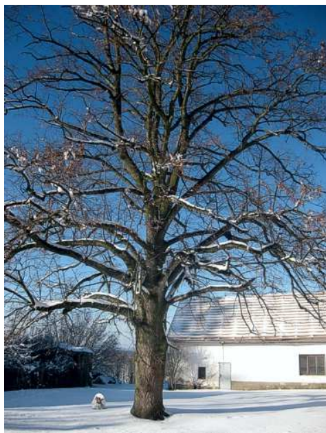
Zábořská lípa v zimním hávu.

Vážený spoluobčané, v minulém čísle našeho Zpravodaje jsem vás tak trochu lákala k procházkám do krásné přírody kolem naší obce. Zmínila jsem i to, že je dobře, že nás ten koronavirus postihl na jaře, kdy se příroda probouzí. No a vidíte, máme ho tu znovu, ve druhé vlně, i když se příroda pomalu ukládá k zimnímu spánku. Kdo by si pomyslel, že tento děsivý malý virus se dostane z dalekého čínského Wu-chanu i k nám, do naší malé obce. Budeme se muset naučit s ním žít. Někdo bere toto onemocnění na lehkou váhu, někdo už má za sebou ale i těžký průběh této nemoci, mnozí se s ní setkali v rodině, škole, na pracovišti. Všichni bychom měli mít z této nemoci veliký respekt a nepodceňovat všechna vládní opatření. Nic se nekoná, nikam nemůžeme, není ani o čem psát.