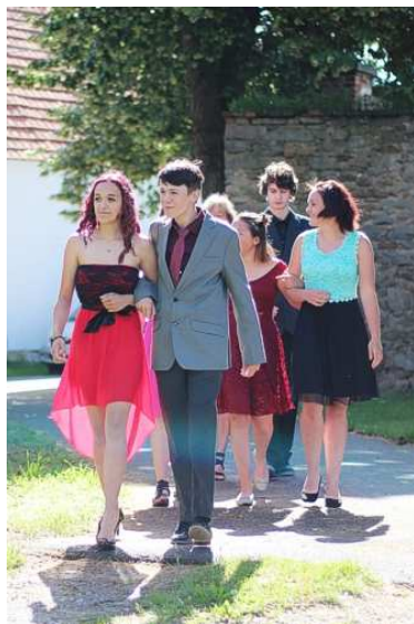
Devítka, dnes naposledy!