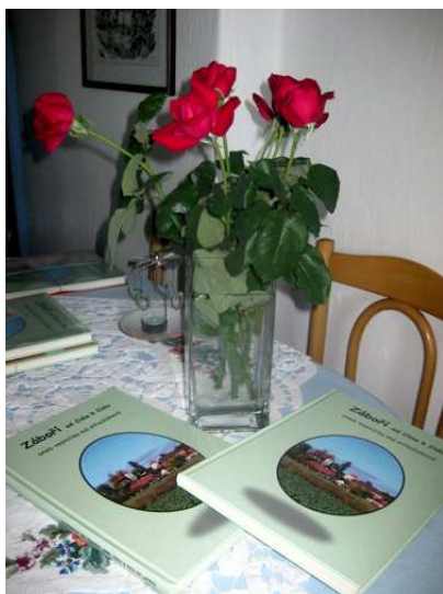
Zátiší s knihou o Záborky.

V poslední době se v mnoha obcích stalo módou pořizovat fotoknihy. Viděla jsem jich už několik. I v naší obci se tento plán zrodil v hlavách dvou našich spoluobčanek. Nápad dotáhly do vítězného konce, i když to rozhodně nebylo jednoduché, ale kniha o Záborky je na světě!