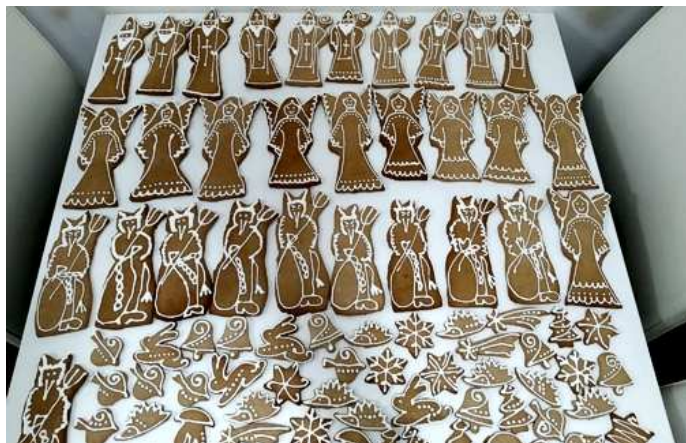
U nás je pečení perníčků a jejich požívání nejoblíbenější tradicí!

Vánoční tradice se po staletí vyvíjejí a proměňují. S rostoucím blahobytem minulého století se začaly objevovat exotické říčky, pistácie, peklo se cukroví z fazolí, brambor nebo polenty Dnes mnohdy osvědčené recepty nahrazují zdravé alternativy. Říká se - sto lidí - sto chutí. Přesto česká klasika je vlastně unikátním kulturním dědictvím.