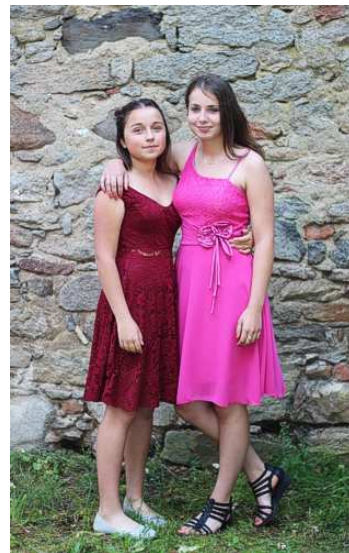
Devětáčkám to slušelo!