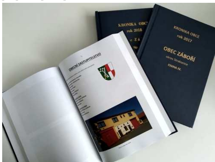
Obecní kroniky v moderní digitální podobě.