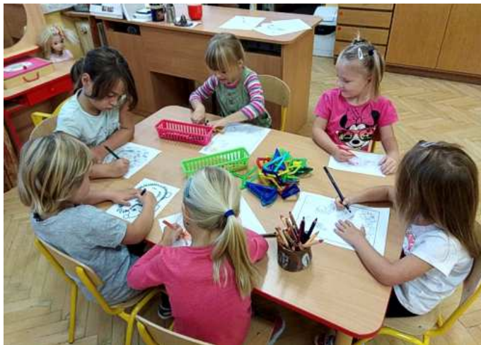
Děti z mateřské školy při práci.

čemu se děti věnují. Kolegyně neustále přicházejí s novými nápady, plánují si další akce. Hezkých činností se ve školce denně odehrává celá řada, ale vždy musí být paní učitelky po celý den ve velkém střehu. Děti jsou zkrátka děti a vždy se může něco stát. Paní učitelka musí mít oči všude.