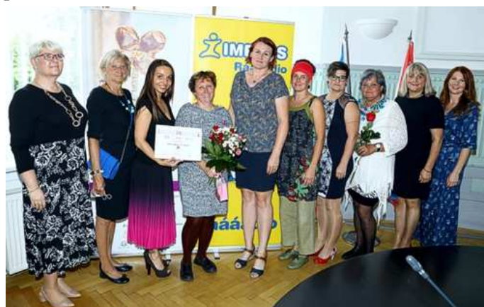
Ocenění převzaly finalistky 7. 9. 2020 na Krajském úřadě v Českých Budějovicích.