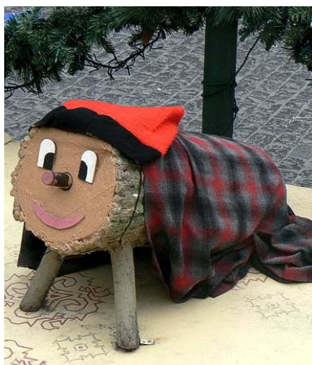
Tío de Nadal

Španělé slaví Vánoce opravdu ve velkém. Jde o katolickou zemi, takže je zde dodržováno velké množství různých zvyků. 24. prosince se podává pozdní večeře s nejrůznějšími pokrmy, které se liší dle regionů. Jde např. o ovčí a kozí speciality, pečeného krocana, ryby či mořské plody a sa-