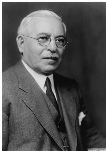
Adolph Joachim Sabath