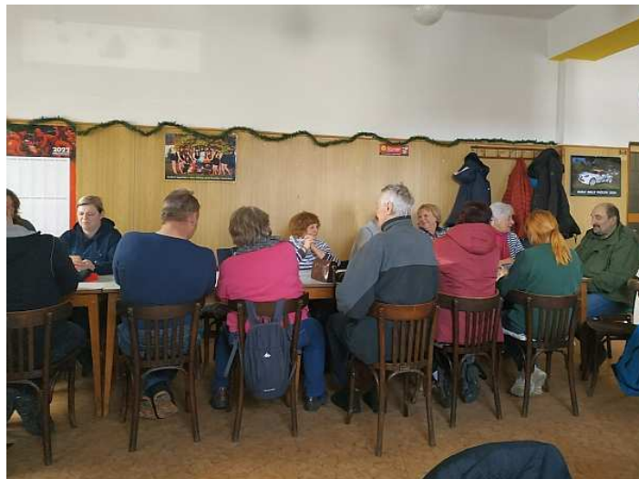
Chvilka odpočinku v mečichovské hospodě

I bez vyhlídky jsme si pochod velmi užili, popovídali jsme si, v hospůdce v Mečichově nás vzorně občerstvili na druhou polovinu cesty.