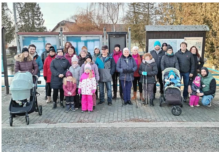
Pochodu se zúčastnily opravdu všechny generace

Pro letošní silvestrovský pochod vybrali organizátoři trasu Záboreň – Mečichov – Čečelovice – Záboreň. Na startu se sešlo hodně turistů všech věkových kategorií, již od kočárku, jak je vidět na fotografii.