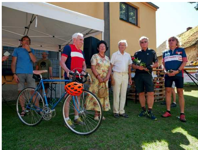
Špičkový chirurg prof. Pafko (s kolem) v Záboří

sedm křížků (špatný odhad, až na internetu se o něm dočtu, že v únoru oslavil 81. narozeniny).