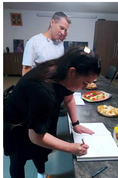
Zápis do pamětní knihy obce

Během probíhající akce pod lípou seděl mezi žáky mateřinky, se zájmem sledoval jejich pasování na prvňáky, potom si povídal s devátáky. Program se mu moc líbil a chválil jak akci samotnou, tak prostředí, ve kterém se konala. Došlo i na popovídání se starostou a ředitelem školy. Bylo o čem povídat, vždyť on sám zastával dvě a půl volebního období funkci starosty