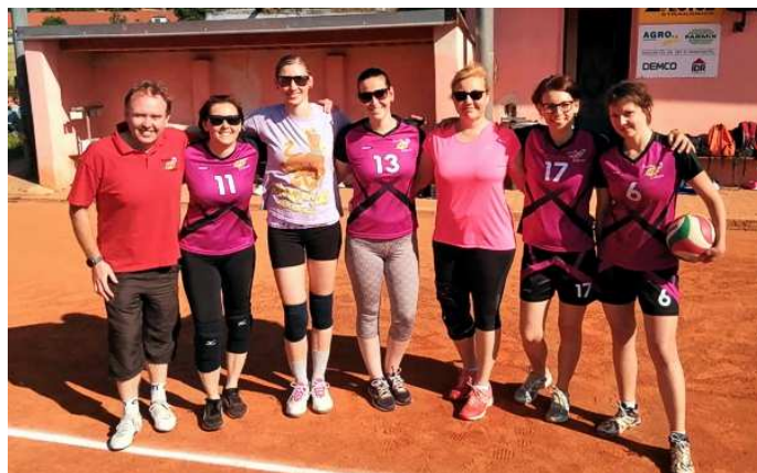
Tým žen na závěrečném kole OP v Radomyšli

Zástupkyně něžného pohlaví měly v minulé sezóně přetěžký úkol – obhájit loňské prvenství. Po nadějném začátku ovšem již v podstatě tradičně začal kolotoč pozeňnaných stavů několika hráček a s tím spojené složitější skládání sestavy na jednotlivá utkání. (A pak že v Zábouří neteče kvalitní voda). Přesto děvčata do poslední chvíle bojovala o bronzovou medaili, bohužel k ní nakonec chyběly pouhé dva body. I tak se ale za své výkony rozhodně nemusely stydět.