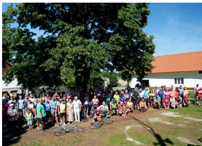
Tour de Battaglia se zúčastnilo přes 200 cyklistů