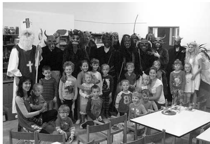
Společná fotografie „andílků“ ze školky s čerty

Mikuláš si už ale asi po dvou hodinách čtení všech hříchů musel odpočinout a jeho kroky směřovaly do mateřské školy. Zde byly děti zřejmě opravdu hodné, vždyť čerti se zde změnili v téměř roztomilé bytosti, se kterými si malí caparti docela dobře rozuměli. Sice se prý podle paní učitelek nějaké malé restíčky našly, ale nestály za to, aby si čerti úplně vykřičeli své již dost unavené hlasivky. Každý drobek tedy těch opravdu jen pár slziček utřel a po obdržení malého dárečku od Mikuláše už se malá očka všech dětí zase rozzářila.