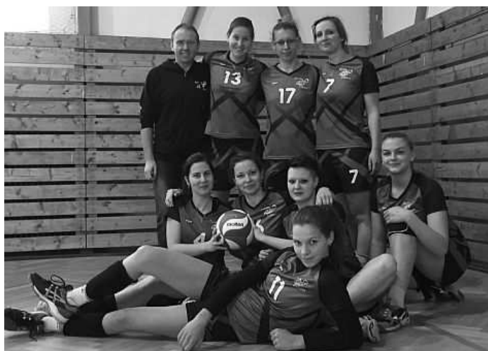
Žířaly Záboreň v nových fialových dresech

Zdá se to až neuvěřitelné, ale zábořští volejbalisté reprezentují svou obec na palubovkách v okresním přeboru již dvanáctým rokem. Jejich ženské protějšky v této statistice zaostávají jen o jednu sezónu. Všichni vyznavači sportu pod vysokou sítí se ale v letošním roce dočkali nádherného dárku. Mohou své tréninky, ale i soutěžní klání absolvovat v opravdu krásně zrekonstruované sportovní hale, která se stala v očích většiny návštěvníků důvodem k velkému obdivu.