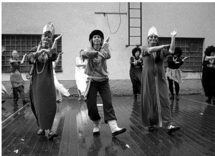
Vystoupení oddílu ZRTV na zábořské pouti

Od začátku halové sezony 2010/2011 využíval oddíl ZRTV sportovní halu každou středu od 20:00 do 21:00 hodin. Po několika letech jsme se přestaly věnovat aerobiku, ale začaly jsme s trochu odlišným druhem pohybu — se zumbou. Zumba je nový fitness program, který kombinuje aerobní cvičení s prvky latinsko-amerických tanců. Zumba je vhodná pro každého bez ohledu na věk a taneční úroveň, je to jednoduché a zábavné tancování, které hýbe světem. Malou ukázkou zumbly jsme si připravily na výroční schůzi TJ ZD Záboreň, toto vystoupení jsme potom zopakovaly na zábořském pouťovém posezení.