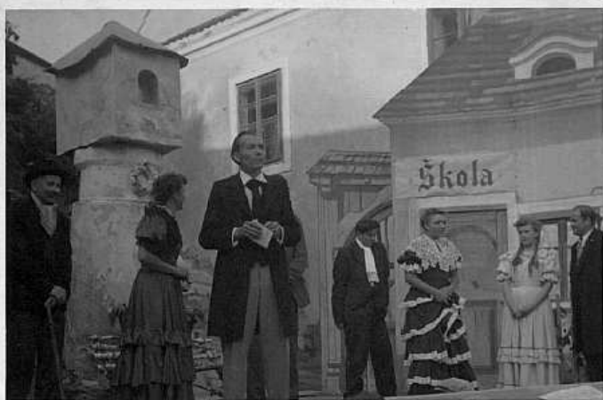
Text J. Říhová, s velkým poděkováním rodině Blažků