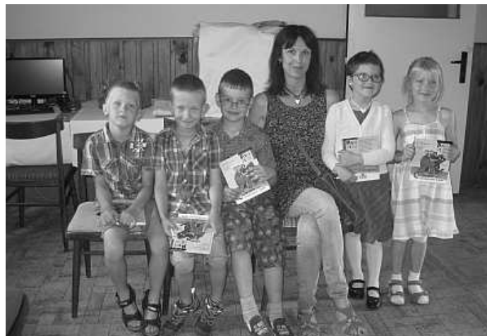
Předškoláci naposledy s paní učitelkou.

na kamarády i učitele. Trochu je i vyzkoušel, dával jim hádanky, které pro ně nebylo zatěžko zvládnout. Když děti začaly počítat do deseti anglicky, panu starostovi spadla brada a pyšné paní učitelce se zaleskly slzy v očích. Ještě přednesly básničku a zazpívaly písničku a pan starosta uznal, že jsou na školu opravdu dobře připravené. Vysloužily si malé občerstvení a pak odešly s paní učitelkou do školky, kde na ně čekal dort.