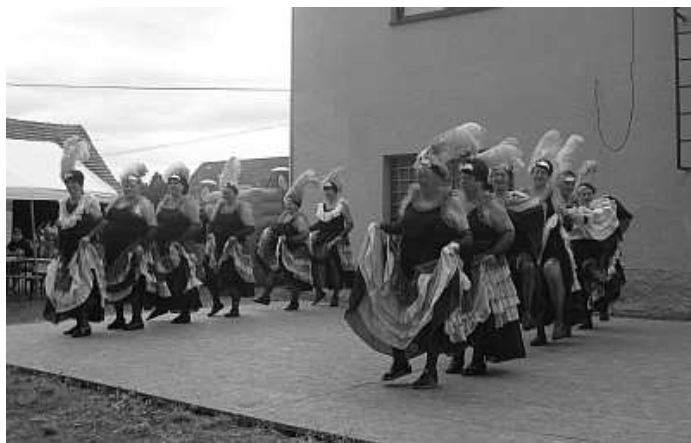
Řepické babči a jejich „šmrncovní“ vystoupení

každou píseň uvedli slovem, aby přiblížili divákům její původ. Dudáci prostě k pouti patří. Mezitím už dorazily žádané a úspěšné Řepické babči, které měly připravená dvě vystoupení. Také už v Záboří vystupovaly na plese, ne všichni je ale viděli. Tyto ženy mají můj obdiv a úctu, protože při jejich věku, většinou korpulentních postavách a nápadných úborech si ji prostě zaslouží. Ono tancovat na svižné melodie nebo dokonce zatancovat kankán není nic jednoduchého ani pro podstatně mladší kategorie. Je na nich vidět, že se rády schází, nacvičují i vystupují a jsou na roztrhání. Před jejich druhým vystoupením už starosta držel očima mraky nahoře, protože jejich kankánové volánové šaty by dostaly deštěm zabrat.