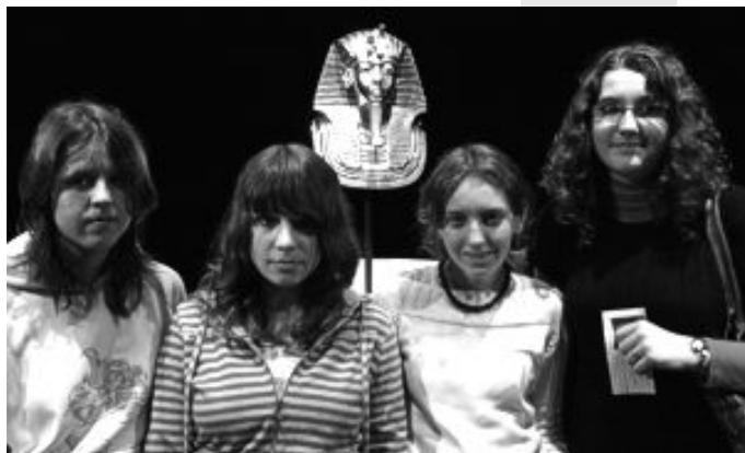
Děvčata před replikou Tutanchamonovy masky

Konečně se všichni nahnuli dovnitř. Nejprve shlédneme krátký film, který vypráví o objevu hrobky, a poté už jen nadšeně prohlížíme vystavené kopie neuvěřitelných pokladů z pohřební výbavy egyptského faraona Tutanchamona. Obdivujeme zlaté sarkofágy, různé modely lodí, krásně zdobené skříňky, sošky, náhrdelníky... a samozřejmě také slavnou pohřební masku Tutanchamona.