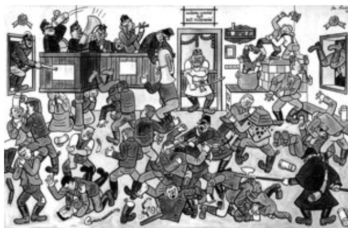
O venkovských pranicích věděl své i Josef Lada

ným, kázal každý den co seděl, 10 ran lískovkou na zadek mu vysolit. Mezi tím museli rychtáři na zámecké nádvoří obeslati všechny svobodné ženské, které při té pranicu v Lažánkách byly, a když je celé vystrašené a v bázni, co se s nimi stane, před ty prasečí kádě předvedli, kde ti zbujníci přivázáni byli, tak k nim hejtman promluvil: „Koukejte, holky, tihle kluci chtějí, abyste byly jejich milenkami, item jednou jejich ženami, item spolu s Vámi chtějí být spoluvlastníci gruntů a chalup, item zástupci vašich rodičů, item členů obecních zastupitelstevch, a teď si samy odpovězte, jací to budou mužové a hospodáři, když dnes, kdy mají ještě mléko na bradě, jsou z nich práci, zhýralci, hulvátí. Potom teprv dal ty kluky od koryt odvázati a domů je propustil. A holky, když z nádvoří odcházely, hlasitě říkaly, že se samy za ně musí stydět.“