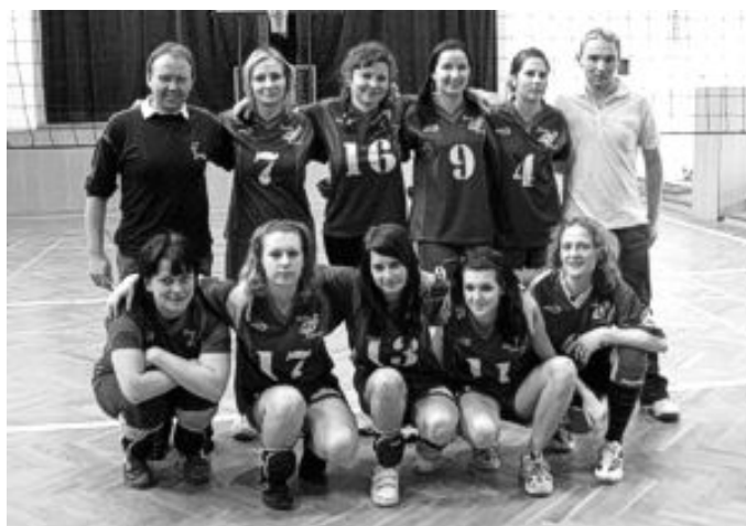
Ženy při OP ve Volyni 7. března 2009

Velmi nadějný začátek, kdy stolní tenisté dokonce atakovali samý vrchol okresního přeboru, přibrzdily dvě prohry s týmy z čela soutěže (Sokolem Strakonice „B“ a Vodňany „D“). Dva zápasy před koncem soutěže tak Zábořští okupují třetí místo tabulky.