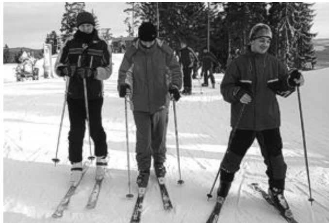
Chlapci na vrcholu Kramolína