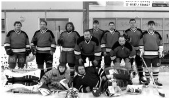
Zábořští hokejisté reprezentovali výtečně!

Po loňském účinkování v Chodské lize reprezentovali zábořští hokejisté v letošním roce naši obec v Šumavské hokejové lize. Své síly postupně změřili s šesti dalšími celky a v konečném zúčtování jim patřila výborná druhá příčka za suverénními Jetenovicemi. Pohár za druhé místo zábořští borci převzali 15. března v Sušici na závěrečném turnaji, na kterém obsadili rovněž pěkně 3. místo. Srdečně gratulujeme!