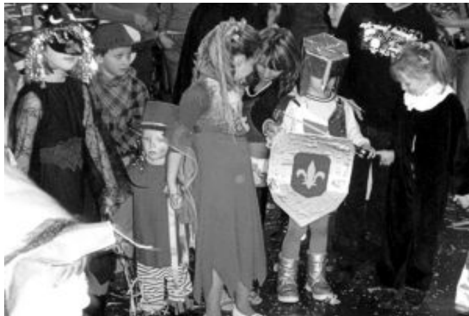
Masek se na ples sešlo i letos mnoho

Žádné masopustní veselí se neobejde bez masek! U nás v Záborky se tradiční průvod maskar nekoná a Bakus nepohřbívá, ale alespoň ti nejmenší nepřišli o báječné dovádění v převlecích různorodých.