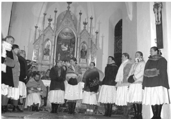
Prácheňský soubor v zábořském kostele

Čtyři dny před Štědrým dnem se zábořská návěs naplnila lidmi. Nevíte proč? Konal se zde totiž vánoční koncert! S odbitím páté hodiny večerní se rozezněla hrdla žáků ZŠ a MŠ Záboří, kteří zaspívali několik koled a ti nejmenší přednesli básně. Tuhou zimu přečkali všichni přítomní také díky teplým nápojům, které zde byly z iniciativy OÚ Záboří servírovány. Poté, co se zásluhou dětí objevily na vánočním stromku prskavky, přesunul se početný zástup návštěvníků do místního kostela, kde vánoční program pokračoval. Nejdříve zaspívaly sestry Strolených a poté vystoupil Prácheňský soubor, který za doprovodu dudácké kapely zakončil povedený vánoční koncert. O úspěchu akce svědčí i fakt, že i přes mrazivé počasí si do kostela našlo cestu více než 200 posluchačů. Příští rok nashledanou!