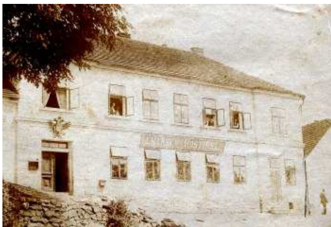
Bývalý Lnářský hostinec v Záboří

Pivovarnictví na Blatensku patří k tradičním živnostem. Zdeněk Lev z Rožmitálu již v roce 1489 udělil blatenským měšťanům právo vařit pivo. Ještě v minulém století byly v Blatné pivovary dva: měšťanský (objekt se dochoval bez vybavení, nachází se v lokalitě V Podzámčí proti marketu Lidl v Blatné) i panský pivovar (dnes lihovar, původní zařízení je zčásti deponováno v Muzeu pivovarnictví v Plzni). Druhý jmenovaný byl uzavřen v devadesátých letech minulého století. To už se zde pivo jen stáčelo, výroba vlastního blatenského piva byla totiž ukončena již v roce 1978 za velké nespokojenosti místních hostinských i občanů. Vždyť se zde mimo jiné vařil velmi oblíbený Kohout, jenž byl považován za nejkvalitnější hned po plzeňském Prazdroji. Zde v Záboří se rovněž pivo vařovalo, a to ve století sedmnáctém v panském pivovaru (stával pod budovou staré školy), který patřil Lnářské vrchnosti. Tento pivovar roku 1658 vyhořel spolu se sladovnou, školou a zvonící. V dochovaných záznamech lze vyčíst, že sládkem byl Jan Vejměchtl, k pivovaru spravoval chmelnici, zahradu se štěpnicí a pole, na kterém se pěstovala zelenina.