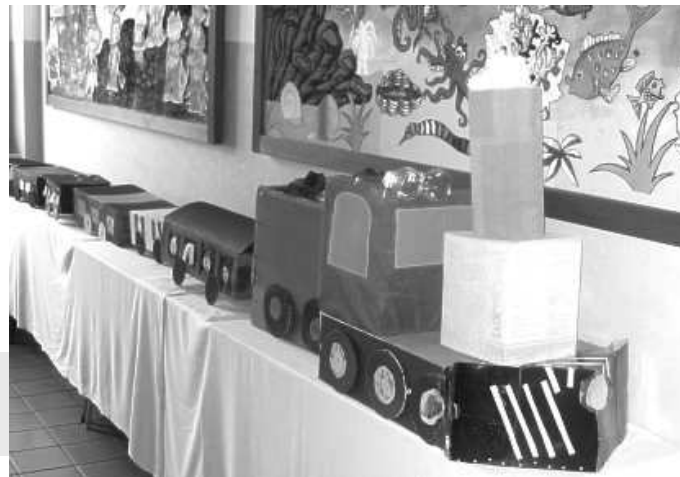
Vítězný model z dílny žáků 9. ročníku

koslovenských drah z 2. poloviny 20. století. Zatímco děti obdivovaly vláčky, rodiče se mohli z plakátů vyrobených dětmi dozvědět spoustu zajímavých informací o historii i současnosti železnice. Znalosti tohoto oboru si všichni prověřili při luštění křížovky nebo v testu. Zjistili, kolik existuje písniček o mašinkách, jak se slova vlak či průvodčí řeknou anglicky nebo se podívali, jak si mládež představuje slušné chování ve vlaku. Pro děti byla připravena matematická železniční pohádka nebo puzzle. Přesto u nich získal největší ohlas krátký železniční okruh, kde si mohly vláček samy pustit a ovládat jeho rychlost.