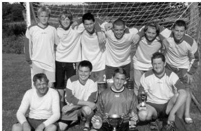
Fotbalisté slaví triumf na turnaji v Lažanech

Na začátku prosince jsme opět pořádali 2. ročník turnaje v nohejbalu, tentokrát už pod názvem „Záboreňská