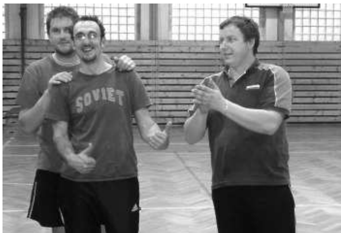
Záboreňští nohejbalisté jako vždy v dobrém rozmaru

V létě jezdíme do nedalekých Lažan, kde jsme tři roky po sobě vyhráli a putovní pohár tak prakticky Záboreň neopouštěl. V loňském roce jsme se v Lažanech bohužel nesešli v nejsilnější sestavě a skončili předposlední. Doufám, že v letošním roce postavíme kvalitní mužstvo, které vybojuje trofej zpět do Záboreň. V létě jsme ještě koncem července byli pozváni na prestižní klání do Drahenic, kde jsme bojovali ve finále se Sedlicí. Tě jsme sice podlehli, ale odvezli jsme si za krásné 2. místo spoustu cen a pěkný pohár do naší sbírky.