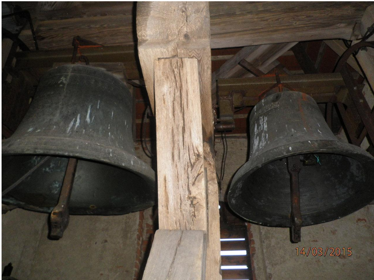
Zábořské zvony – vlevo sv. Petr, vpravo sv. Pavel